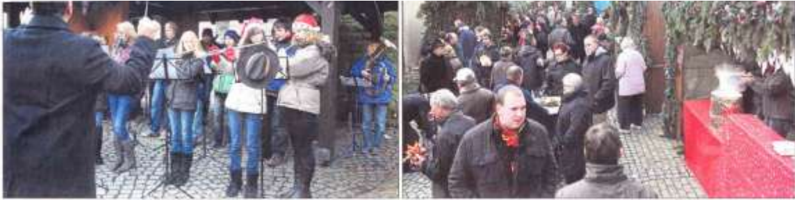
Rund ums Rathaus: Beim Weihnachtsmarkt in Unterweissach spielte gestern die Jugendkapelle des Musikvereins Unterweissach (links). Zahlreiche Besucher hörten zu und schlenderten übers Pflaster.