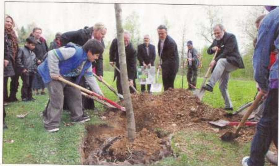
Mit vereinten Kräften: Im Plattenwald wird eine Elsbeere gepflanzt; sie ist der Baum des Jahres.

2011 wurde die Elsbeere ( Sorbus torminalis L.) zum Baum des Jahres ausgerufen. Botanisch gehört der Wildobstbaum zur Familie der Rosaceae, des Rosengewächsen (wie zum Beispiel die Vogelkirsche, Apfel oder Birne), und zur Gattung der Sorbus-Arten. Sie ist eine von vier in Deutschland vorkommenden Sorbus-Arten. Von diesem Quartett ist aber nur eine, die Vogelbeere (Ebensche, Sorbus aucuparia L.) häufig. Mit ihren fünfzig Schwestern, der Mohlbeere ( Sorbus aria ), dem Speierling ( Sorbus domestica L.), teilt sich die Elsbeere das Schicksal, eine seltene Baumart und damit weitgehend unbekannt zu sein.