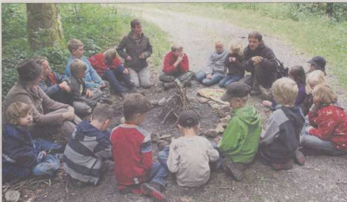
Kreatives Spielen und arbeiten in Gruppen: Kinder erlangen Achtsamkeit gegenüber der Natur und Wissen über Pflanzen und Tiere.