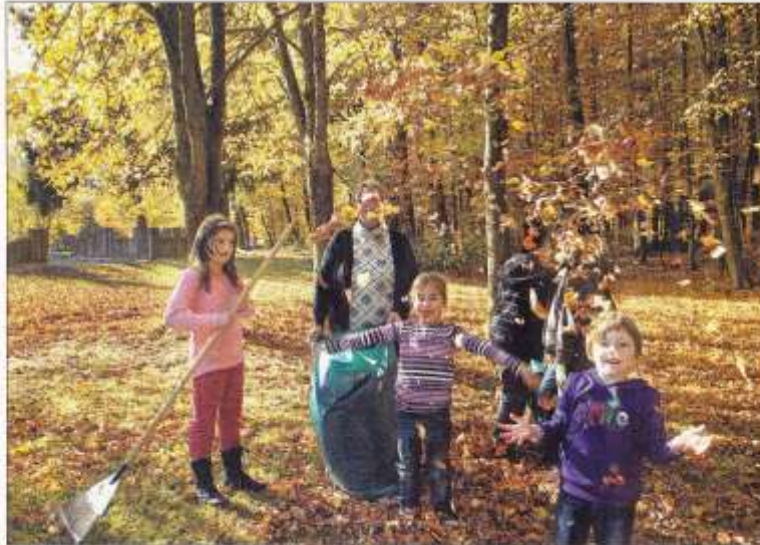
Waren mit Eifer bei der Kastanienlaubsammelaktion auf dem Plattenwaldspielplatz mit dabei: Schüler der Taus- und Plattenhölle.