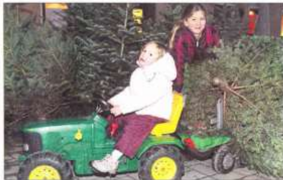
Ja, das ist der Richtige: Zwei Mädchen in Naasach proben schon mal den Weihnachtsbaumkauf.

Immergrüne Pflanzen waren schon zu Zeiten der Römer Symbole für Lebenskraft, jedoch erst im ausgehenden Mittelalter wurden Bäume mit Süßigkeiten, Äpfeln und Kerzen geschmückt. Mit der großen Aufforstung mit Nadelbäumen in der zweiten Hälfte des 19. Jahrhunderts waren diese Weihnachtsbäume dann nicht mehr nur wohlhabenden Kreisen vorbehalten. Dieser Weihnachtsbrauch verbreitete sich im 19. Jahrhundert von Deutschland aus über die ganze Welt.